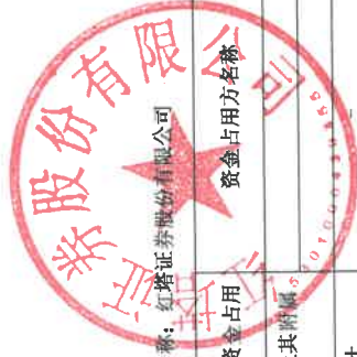
2022年度非经营性资金占用及其他关联资金往来情况汇总表